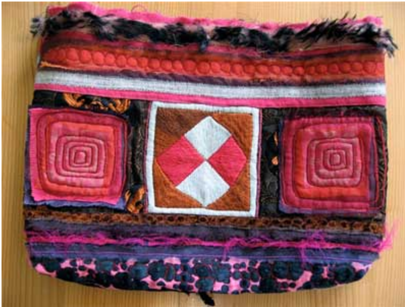
tutte le opere ©Judith Mundwiler